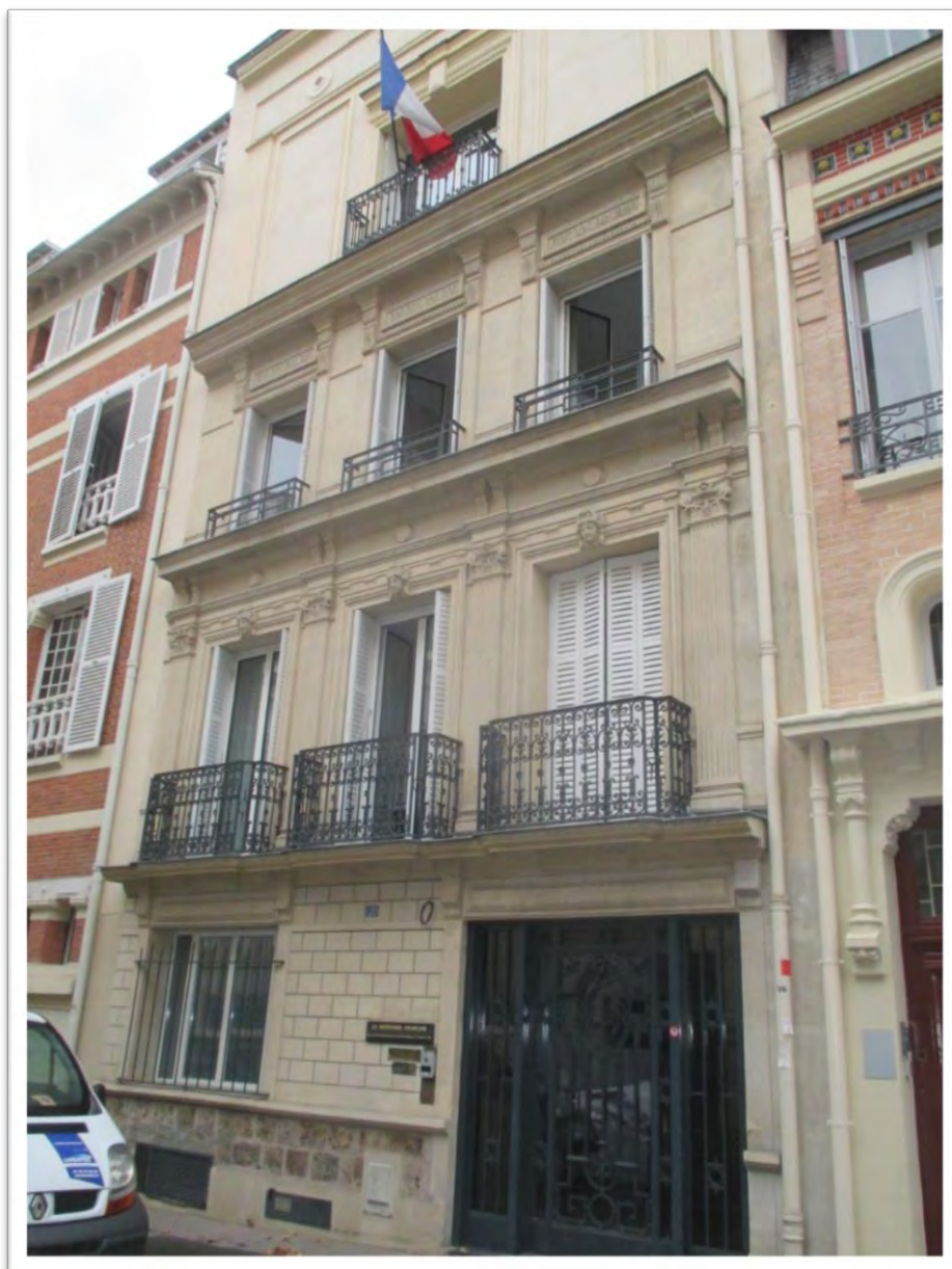
Le Siège du Souvenir Français au 20 rue Eugène Flachat à Paris 17 ème arrondissement