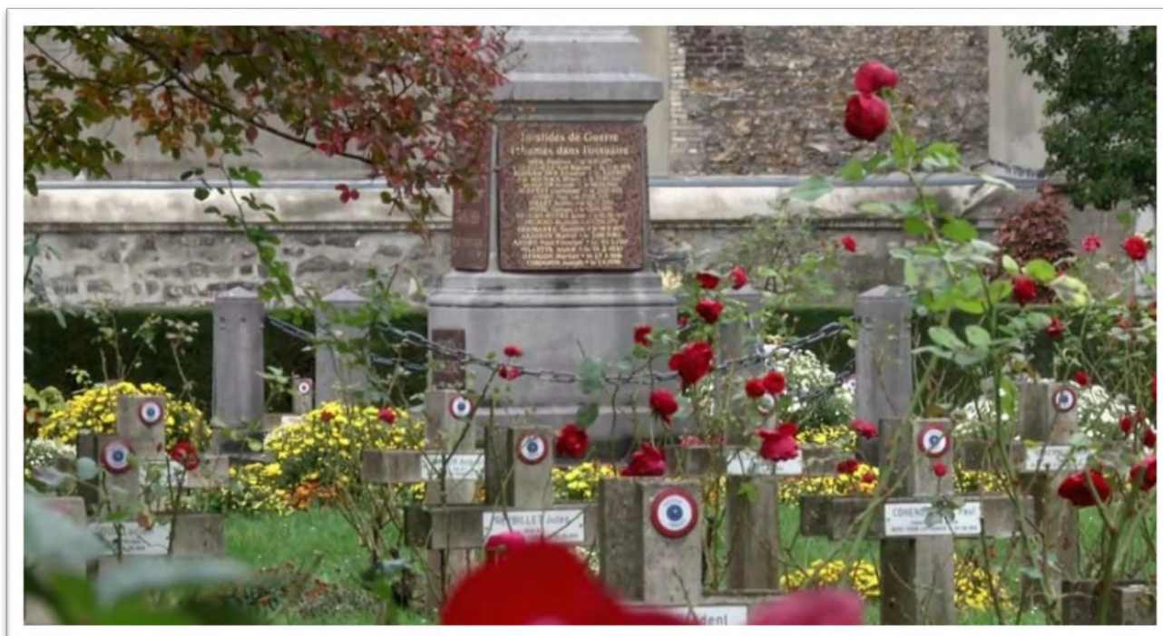
La quête sert à entretenir les tombes de soldats Morts pour la France