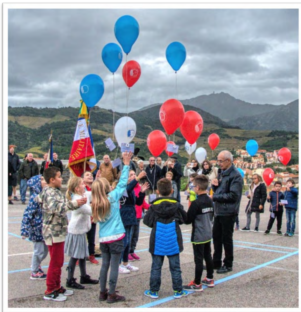
Lâché de ballons à Collioure pour le 11 novembre (66)

Parallèlement la mobilisation en retour des scolaires et des enseignants pour les initiatives organisées par le comité : cérémonies, mise en valeur de sites patrimoniaux, participation aux quêtes, doit être évoquée.