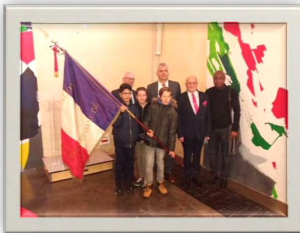
Dépôt du drapeau Rhin et Danube de l'Ain (01) au collège Xavier Bichat de Nantua le 15 mars 2018

Dans un premier temps et jusqu'en 2025, seuls les comités nouvellement créés devront impérativement s'organiser sur la nouvelle géographie administrative.