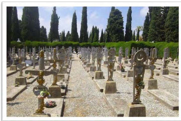
Carré militaire à Nice (06)