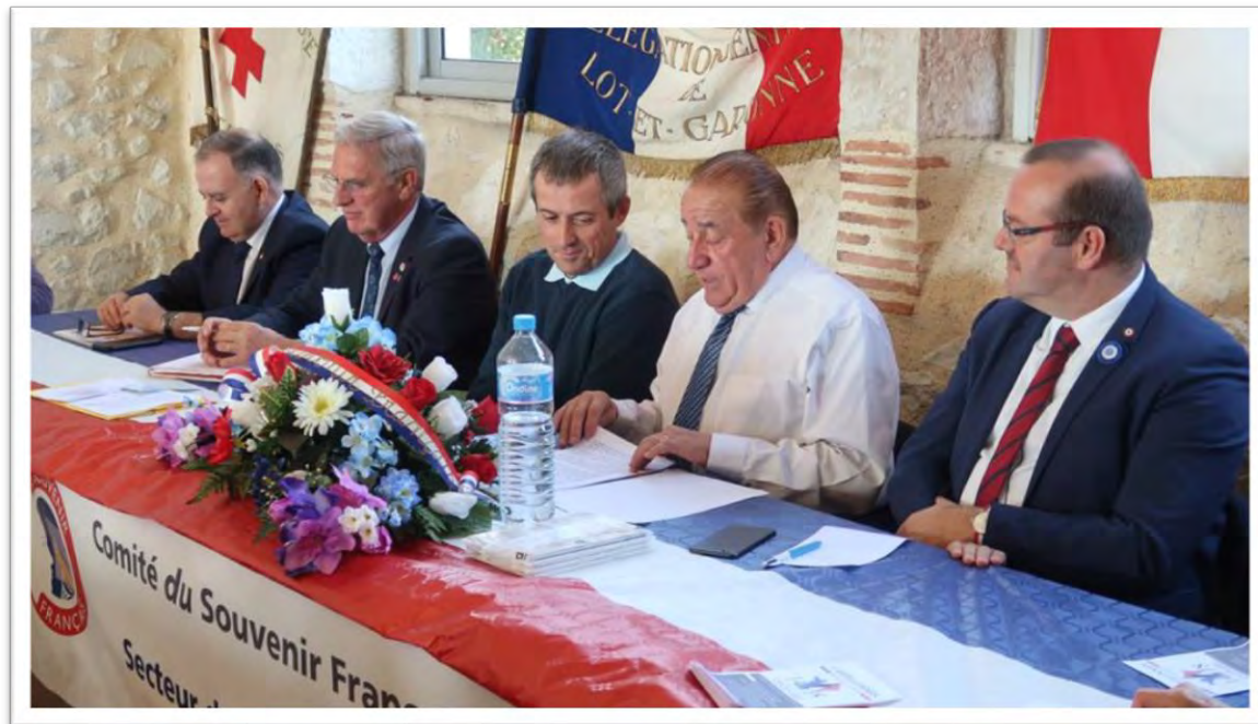
Réunion des adhérents du canton de Castillonnès (47)

L'élection est coordonnée par le bureau de la délégation générale.